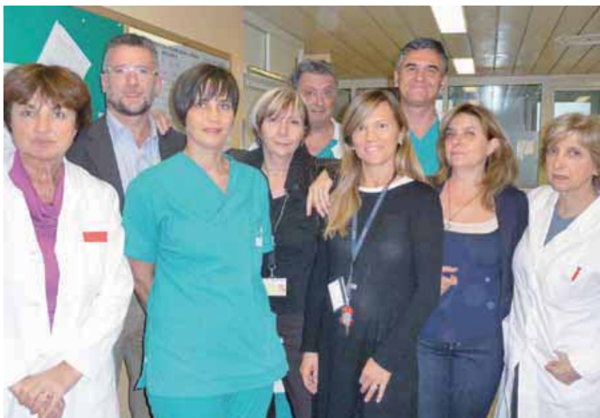
Alcuni componenti del gruppo operativo “Ospedale senza Dolore”.

Il Gruppo Operativo “Ospedale Senza Dolore” ha sviluppato varie iniziative nell’ambito di competenza ed ha supportato l’attività riguardante gli obiettivi di budget sul “Dolore” di varie Unità Operative Ospedaliere: