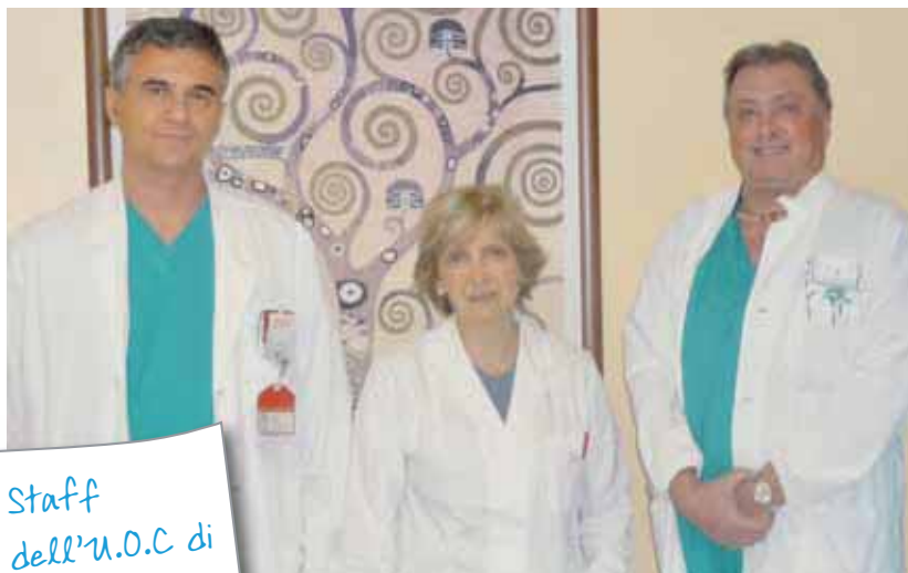
Staff dell'U.O.C di Anestesia e Rianimazione